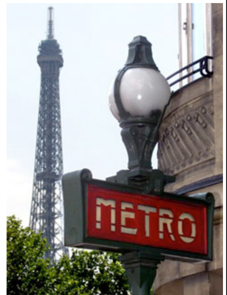
Une alternative au plan de transports en commun.

Ainsi pas d'erreur possible dans le choix des directions et des stations de correspondance puisqu'elles sont indiquées automatiquement par l'appareil.